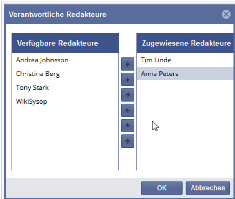
Screenshot: Verantwortlichkeit eines Artikels ändern

In dem Dialog stehen Ihnen folgende Aktionen zur Verfügung: